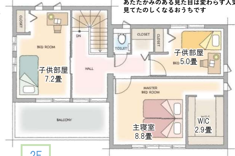
画像はすべてイメージです