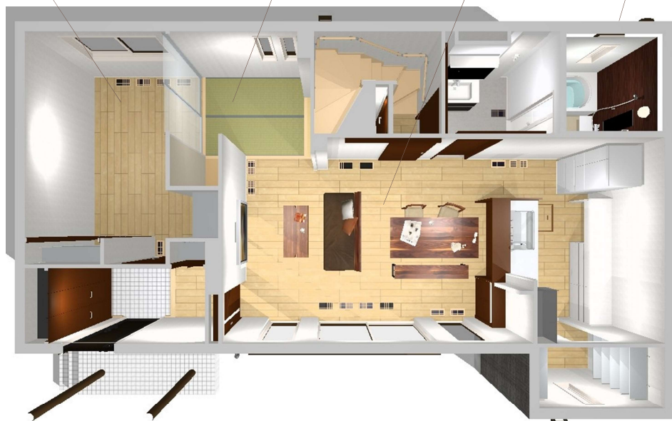
First floor plan

●趣味のお部屋● 趣味に没頭できる個室 家族の気配を近くに感じながらも 集中できる空間です