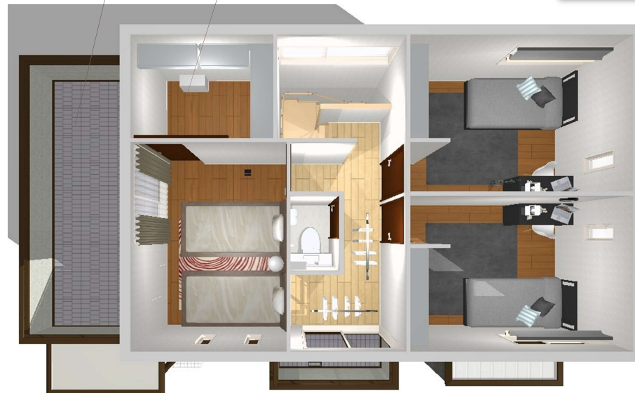
Second floor plan